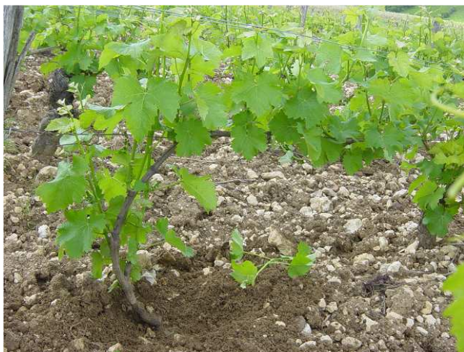
Cep trois ans après le greffage

La technique du greffage est détaillé dans la fiche technique "Le Regreffage" éditée par SICAVAC.