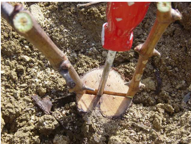
Mise en place des greffons après avoir décapité le cep sous le point de greffe

Le greffage se fait au printemps en décapitant le cep sous le point de greffe et en réalisant un greffage en fente directement sur le porte-greffe. Cette solution est plus technique que le recépage mais offre également de très bons taux de reprise (> 90%) lorsqu'elle est effectuée en conditions optimales.