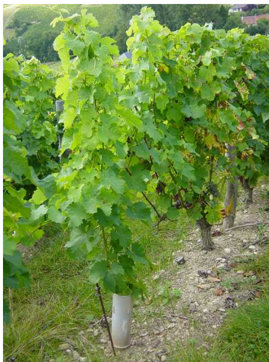
Cep trois mois après le greffage